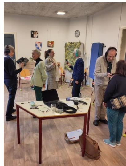
Foto: Deelnemers aan het podcastproject hard aan het werk.